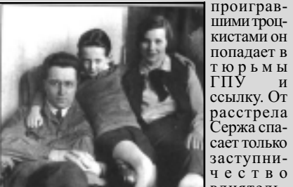
В.Серж и его семья

Эта книга участника французского и российского революционного движения начала 20 века Виктора Сержа. Писатель делится воспоминаниями о революционной Франции и Испании перед Первой мировой войной. В 1919 году он едет в Питер. Перед ним открывается опустошенный голодом и войной город. Партийная элита уже добивается первых, пока еще призрачных, привилегий. Серж работает в созданном на его глазах Коминтерне, готовится к уличным боям с наступающими белогвардейцами. Перекосы новой власти кажутся ему неизбежными издержками. Но они нарастают. Привыкнув к гуманизму европейских левых, Серж не может смириться с произволом ЧК и подавлением всякой свободы. С годами это приводит его в левую оппозицию. Перед автором раскрывается механизм борьбы конкурирующих партийных блоков. Вместе с проигравшими троцкистами он попадает в тюрьмы ГПУ и ссылки. От расстрела Сержа спасает только заступничество влиятельных западных левых. В 1936-м В.Серж возвращается в Европу. Он наблюдает гражданскую войну в Испании, критикует режим в СССР, наталкивается на ненависть про сталинских компартий. Незадолго до смерти, в 1942-43 годах, Серж описывает все это в своей книге. Литературный талант автора и обилие житейских подробностей придает ей легкость приключенческого романа, знание исторических фактов - глубину научного исследования.